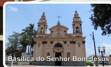
Basilica do Senhor Bom Jesus