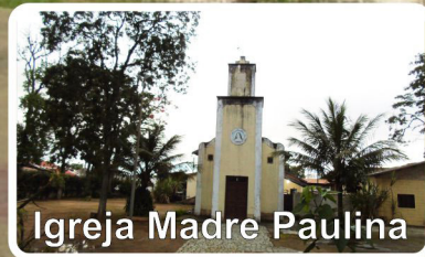
Igreja Madre Paulina