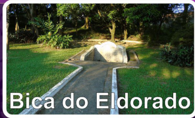
Bica do Eldorado