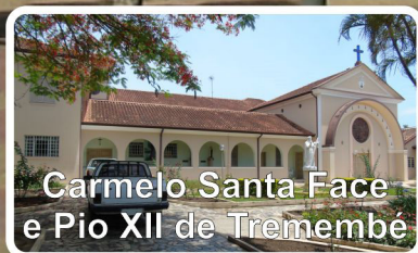
Carmelo Santa Face e Pio XII de Tremembé