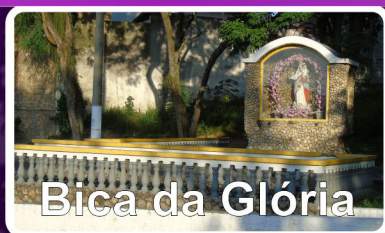
Bica da Glória