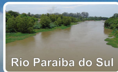
Rio Paraiba do Sul