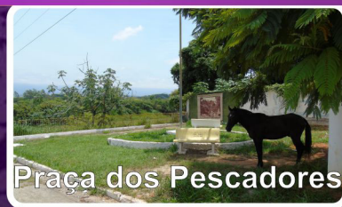
Praça dos Pescadores