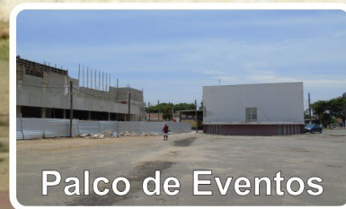
Palco de Eventos